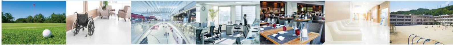
飲食店・商業施設・病院・学校・会社・レジャー・介護施設などで

人の健康も企業の成長も、日々のリスク管理から始まります 自身のためではなく、あなたの周りの人のために